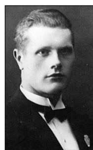
Arno Niitme 1928. aastal