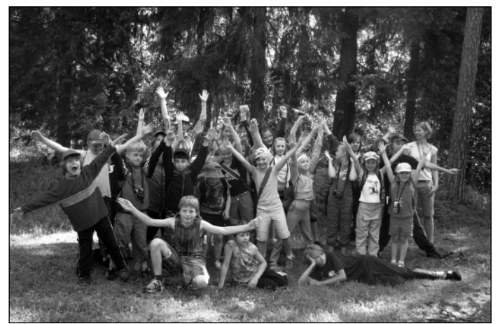
Lastele jäid laagrist mälestuseks loodusraamat, ühine laagripilt ja tunnustus laagri läbimise kohta ning muidugi enda valmistatud asjad...

Looduslaagri viimane päev algas mullaalustiku õppimisega. Juhendaja Külli Kalamehe abiga vaadati, kes elab sambla ja paku all, kes peidab end puujuure alla. Lastele pakkus suurt huvi putukaid uurida ja määramiseks purki koguda. Lõpuks sai iga meeskond lustakalt ka üht putukat mängida. Putukaretkele järgnes looduses ellujäämise õpetus, kus kõikidel tuli korjata tee äärest mürgiseid ja