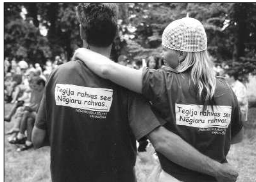
Nagu särkidelt lugeda võib, on Nõgiaru rahvas üks tegija rahvas. Eks seda tõestas ka nende võit külade mängudel valla arvestuses.