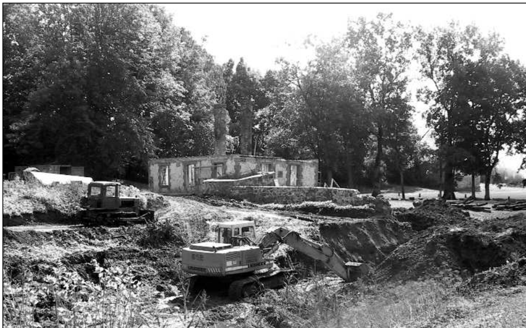
Kärnerimaja ja tiikide rekonstrueerimistööd käivad käsikäes.