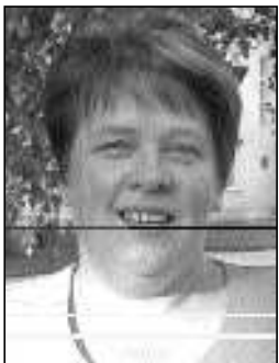
MAIRE ULST kandidaat nr 122

Pea tähtsaks perekonda, haridust, spordi ja muusikaga tegelemist. Hindan kõrgelt heatahtlikku ja mõistvat suhtumist kaasinimesesse. Olen abielus, perekonnas täiskasvanud poeg ja tütar.