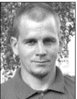
KAIDO VOOR kandidaat nr 123

Olen 33-aastane noor mees, kes on sündinud, elanud ja tahab jääda elama oma koduvalda, Laguja kanti, ja arendada oma majapidamist Sassi külas.