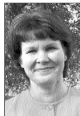
ENE ARUS kandidaat nr 106

Olen abielus, minu kolm poega elavad iseseisvat elu.