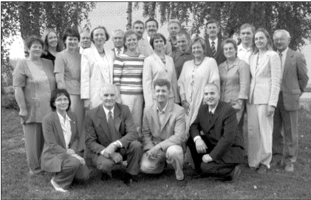
Eestimaa Rahvaliidu kandidaadid