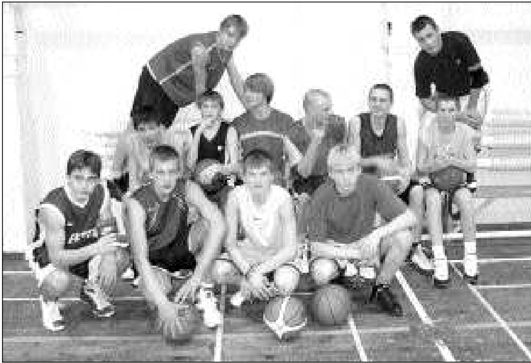
9.-12. klassi trennipoisid

Teisel päeval, 8. jaanuaril olid esimese vanusegrupina ajakavas U20 meeste mängud. Ülekaaluka võidu teenis Estonianballaz'i võistkond, kes näitas turniiri ilusaimat mängu, mida vürtsitasid uskumatud söödud, ilusad pealtpanekud ja alley-oop 'id ning stabiilselt tabavad visked. Teistel võistkondadel ei jäänud üle muud, kui imestada ilusate soorituste üle ja omavahel hästi mängida. Teise koha võitsid Võrratud Nõo SG ees. Ja viimasena ning kõige oodatumana võistlesid meeste-klassi võistkonnad. Mängud olid palju jõulisemad ja kiiremad kui varasemates alagruppides. Oodatult võidutses Decol Ehitus, mis on koos Estonianballaziga kindlasti Eesti üks parimaid tänavakorvpallivõistkondi. Teise koha teenis